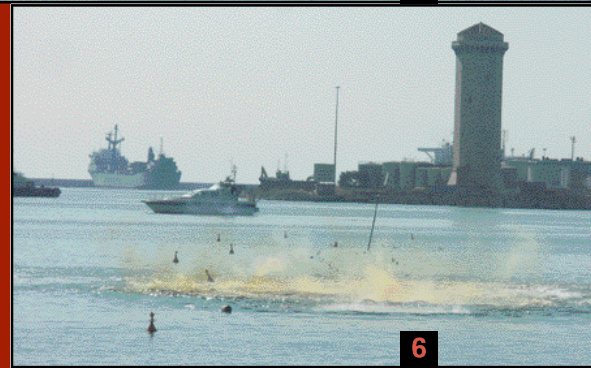
figura 4 Caricamento della volata figura 5 Completamento del circuito di tiro figura 6 Risalta del gas di esplosione